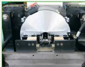
Зажим (с специальными кулачками)